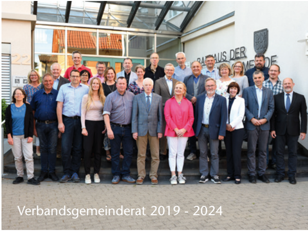
Verbandsgemeinderat 2019 - 2024

den Fahrradbeauftragten, den Fluglärmbeauftragten, die Integrationsbeauftragte, den Behinderten- und den Seniorenbeauftragten.